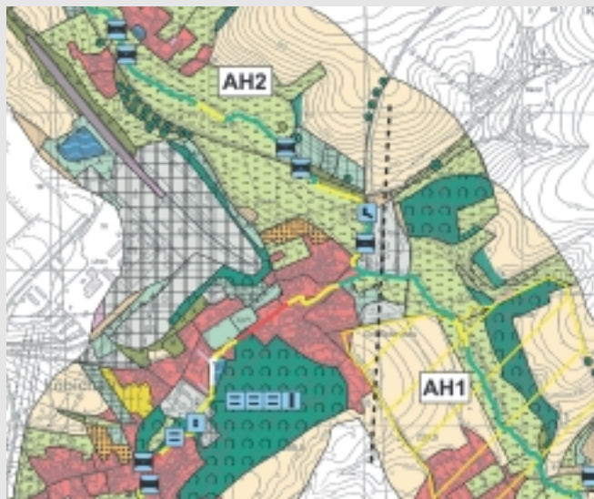
Bestandskartierung: Flächennutzung, Bauwerke, Gesamtbewertung

Hier sind intelligente Lösungen gefragt, die auch unter den Bedingungen allgemein knapper Haushaltslagen effektiv Wirkung zeigen. Durch die Verabschiedung der Europäischen Wasserrahmenrichtlinie und deren zu erwartende Umsetzung in Landesrecht wird der Entwicklung und Unterhaltung der Gewässer eine noch stärkere Bedeutung zukommen.