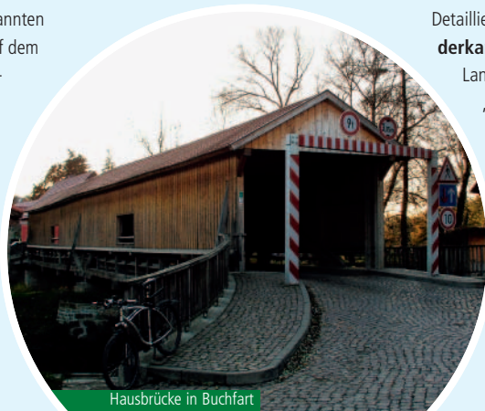
Hausbrücke in Buchfart

Detaillierte Wanderinformationen finden Sie in den Wanderkarten „Mittlerer Thüringer Wald“ und „Weimarer Land und Umgebung“ (Maßstab 1:50.000) sowie „Gräfinau-Angstedt, Gehren und Königsee“ und „Stadtilm und Mittleres Ilmtal“ (Maßstab 1:30.000) des Verlags Grünes Herz. Zahlreiche geführte Wanderungen und Stadtpaziergänge zu vielfältigen Themen sowie Falblätter zu gut beschilderten Themenwegen werden durch die lokalen Touristeninformationsstellen angeboten.