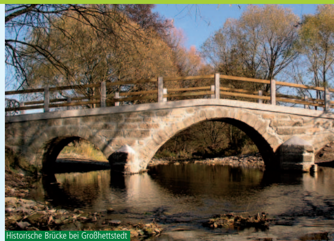
Historische Brücke bei Großhettstedt

Mit der Ilm verlassen wir den Thüringer Wald und gehen ins Muschelkalkgebiet der Ilm-Saale-Platte über. Wiesen und Felder sind nun neben dem Wald häufiger zu sehen. Die Flora hat zahlreiche Schön- und Seltenheiten zu bieten.