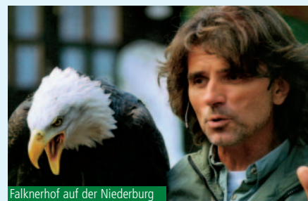
Falknerhof auf der Niederburg

In Hohenfelden macht ein Freilichtmuseum mit 30 historischen Gebäuden erlebbar, wie in Mittelthüringer Dörfern früher gebaut, gelebt und gearbeitet wurde. Unweit davon kann man sich in einem weitläufigen Erholungsgebiet am 40 ha großen Stausee entspannen oder sportlich betätigen. Nicht nur bei schlechtem Wetter lohnt sich ein Besuch in der benachbarten Avenida-Therme mit großer Saunalandschaft. Den reizvollen Abschnitt des Ilmtales kann man auch herrlich vom Fenster der 1887 eröffneten Ilmtalbahn Kranichfeld-Weimar genießen.