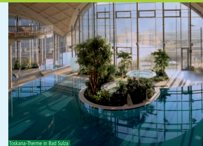
Toskana-Therme in Bad Sulza

In der weiten offenen Landschaft mit ihren sanften Hügeln, blühenden Mohn- und Rapsfeldern, ursprünglichen Dörfern, Burgen und Schlössern fühlt man sich wahrlich in der „ Toskana des Ostens “, wie die Gegend auch genannt wird.