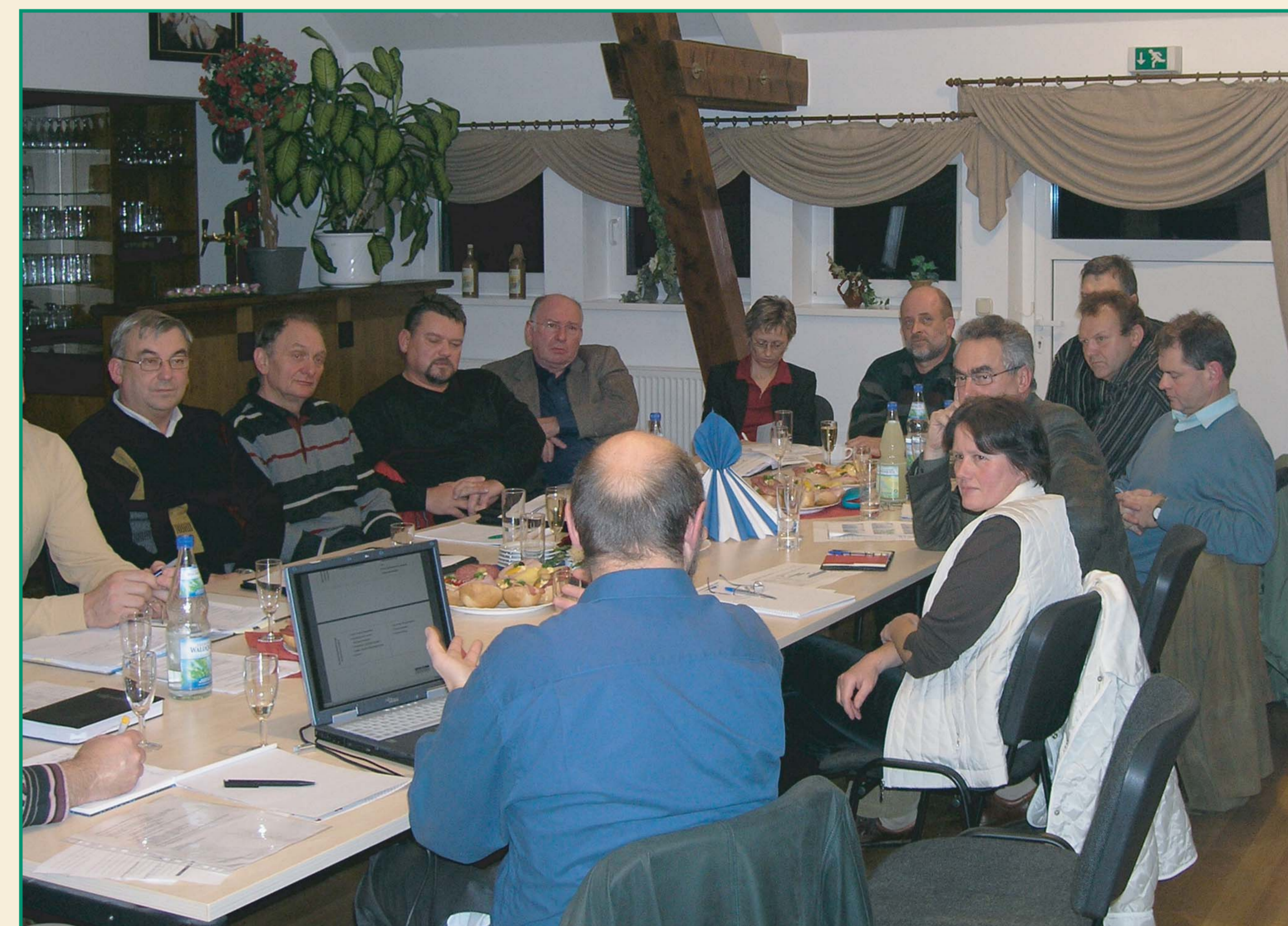
Anlaufberatung am 27.11.2006 mit den Bürgermeistern